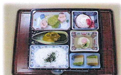
ペースト食(お花見弁当)