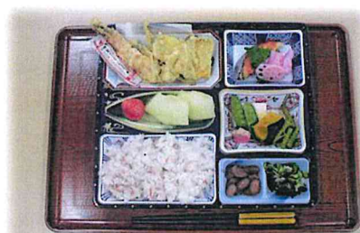
普通食(お花見弁当)